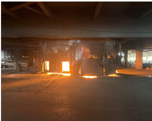
图表2：工业硅矿热炉