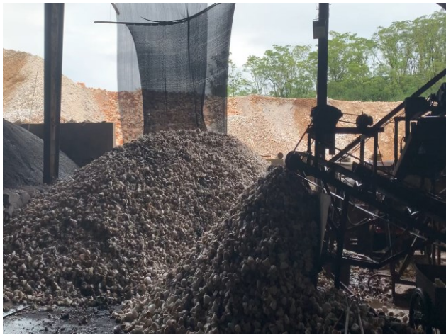
图表4：硅石清洗车间