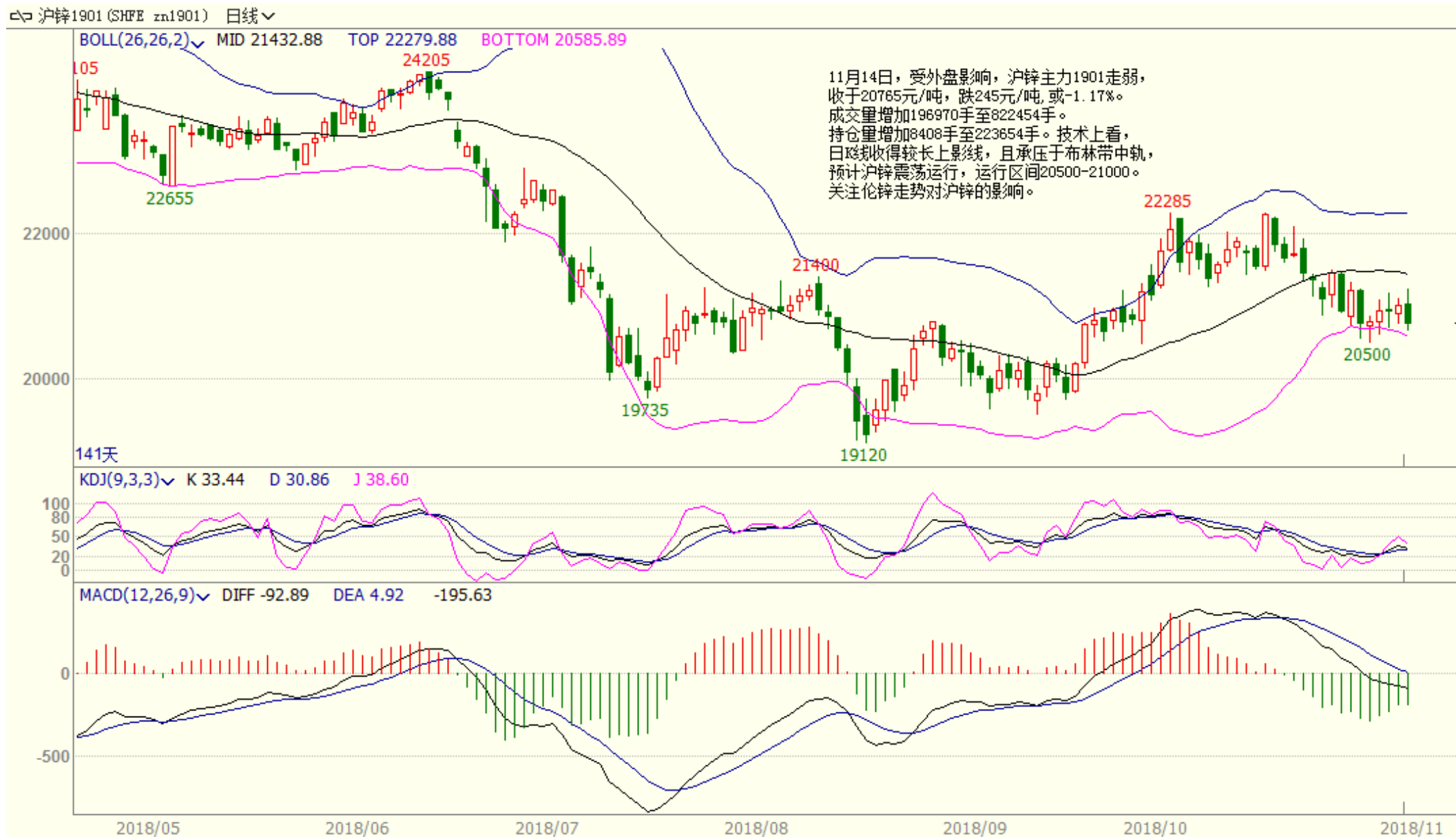
图：沪锌日 K 线